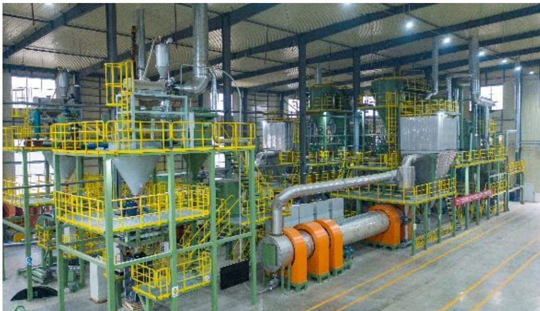
智能化炭黑深加工装备