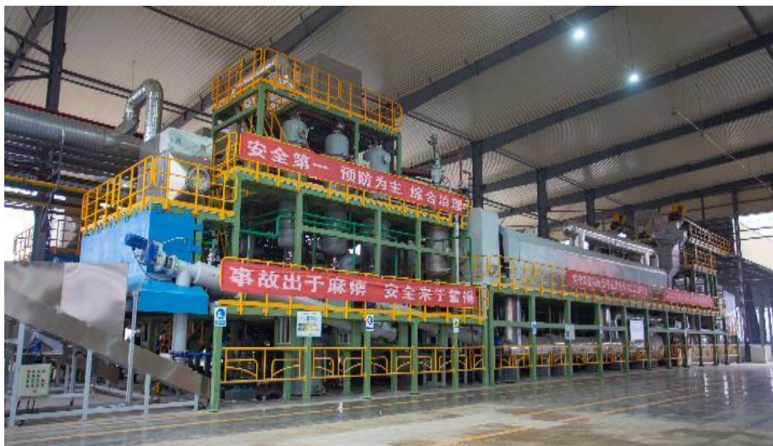
废旧橡塑智能化连续裂解生产线

该成果创新连续高效裂解、炭黑湿法造粒等技术，解决了动态密封、裂解炭黑附加值低等行业关键技术难题。废旧轮胎在微负压条件下经无害化处理获得40%再生油、35%环保炭黑、13%钢丝和12%可燃气。其中，环保炭黑可替代工业炭黑用于轮胎、橡胶制品等再生产，再生油精炼后可作为燃料油，钢丝可再次冶炼使用，可燃气可作为燃料回用于生产，同时配套污水处理系统、除尘除味和脱硫脱硝系统等环保设施，实现“零排放、零残留、零污染、全利用”。